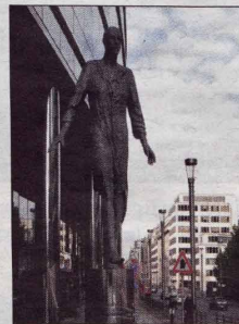
■ Stepping Forward, voor het gebouw van de Europese Raad in Brussel.